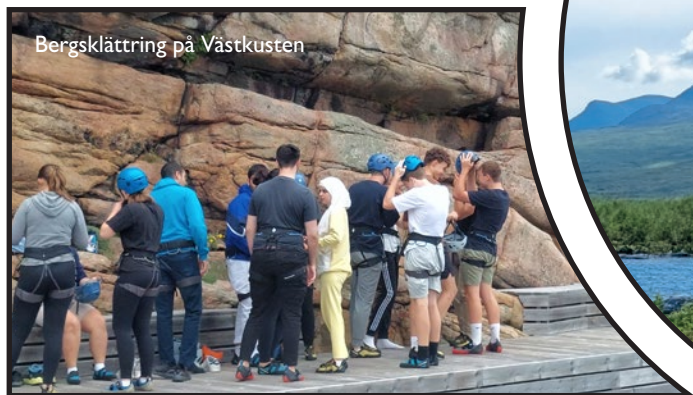
Bergsklättring på Västkusten