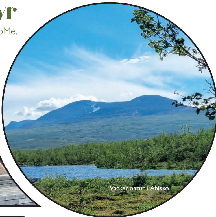
Vacker natur i Abisko