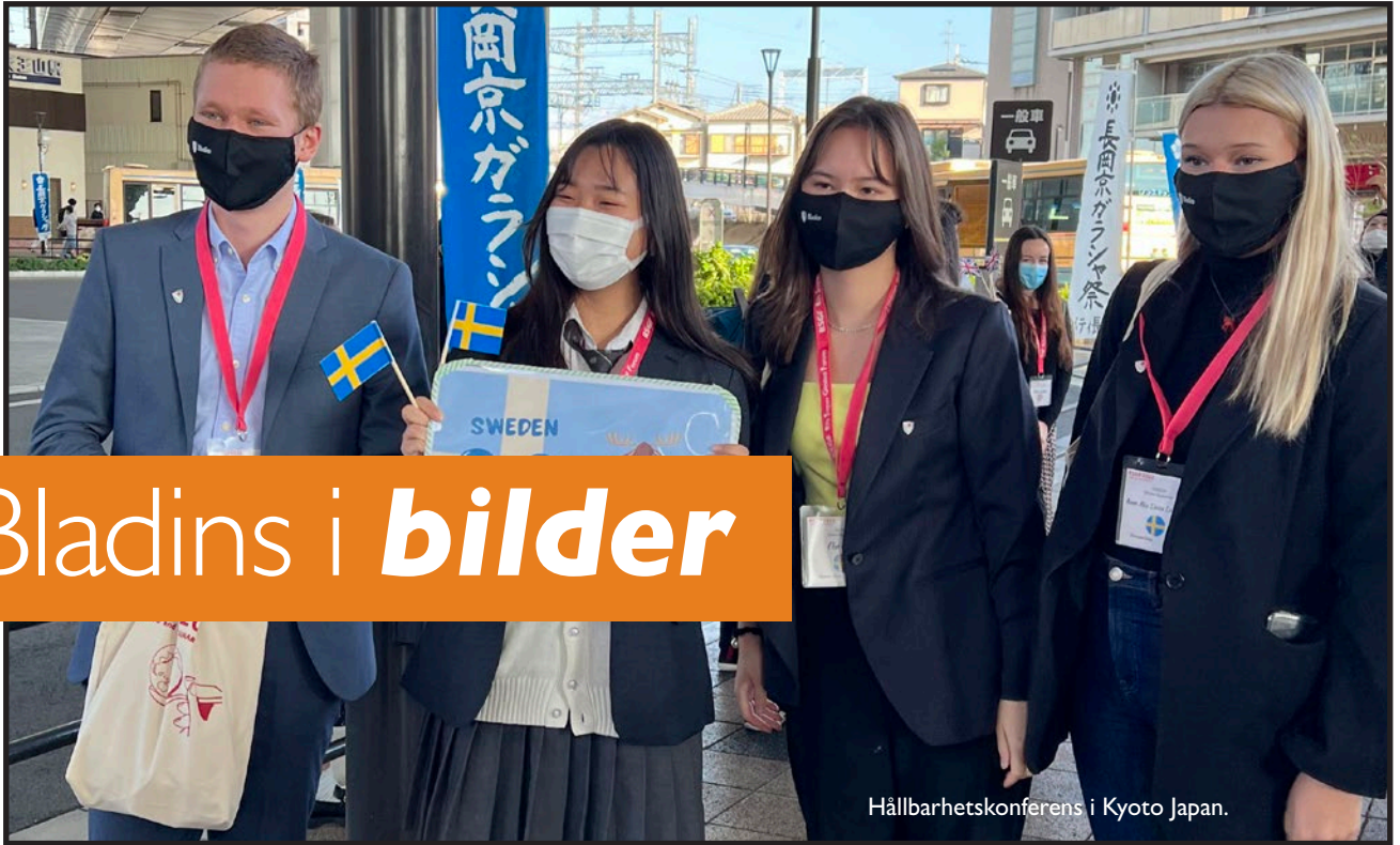
Hållbarhetskonferens i Kyoto Japan.